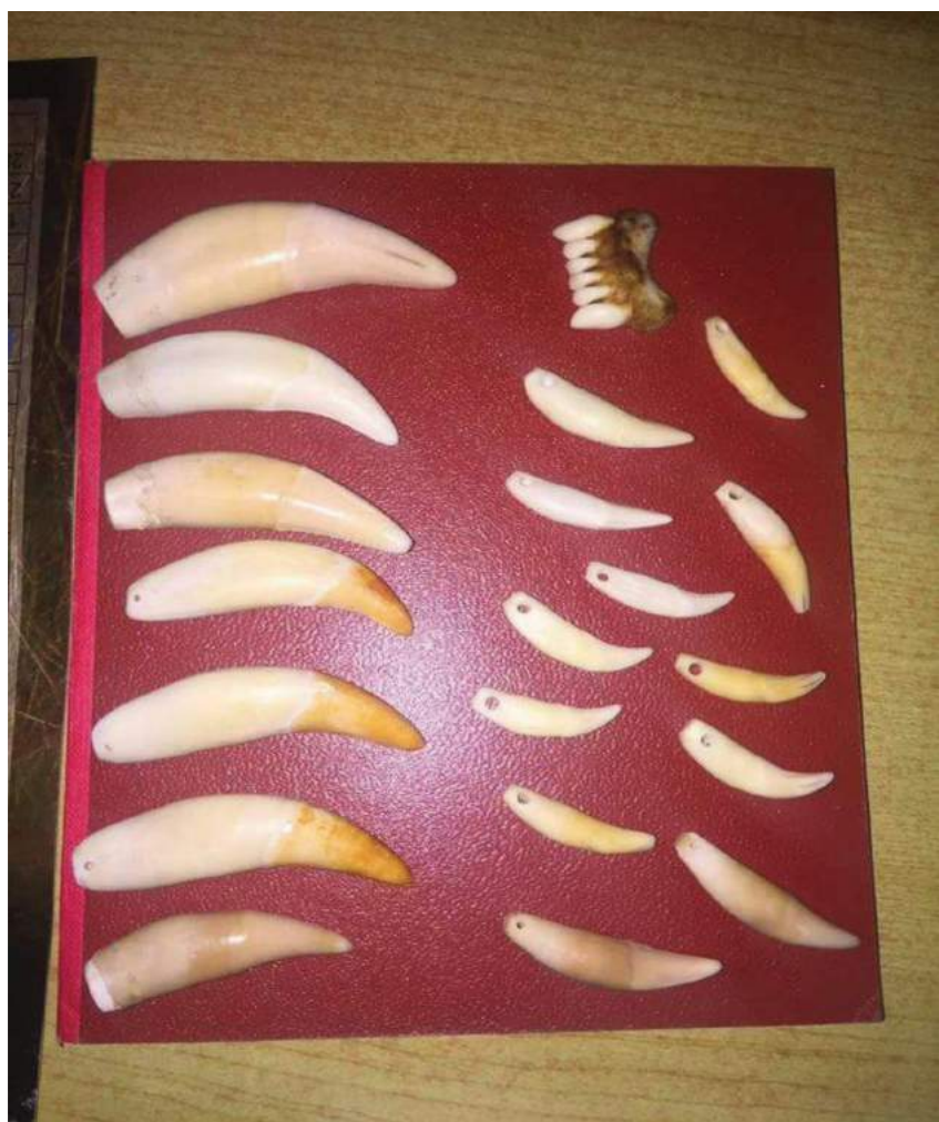
Imagen a la derecha: Comercio de joyas: las partes del cuerpo de Jaguar se utilizan principalmente para la medicina tradicional asiática, pero sus dientes y garras a menudo se venden por separado en las joyerías de Surinam.