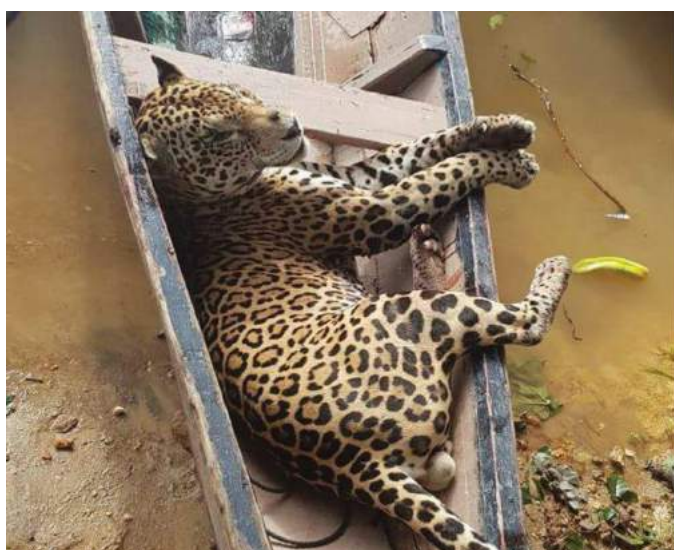
Imagen: Carga preciosa: los jaguares a los que les han disparado son transportados en una variedad de formas fuera de su hábitat natural de la selva y vendidos a los intermediarios que los llevan a las zonas urbanas para su procesamiento. Izquierda: Jaguar fusilado en una canoa; a la derecha: jaguar siendo llevado a través de un pueblo; Abajo: jaguar atado a un poste.

El procesamiento y la venta se producen en gran medida en torno a Paramaribo, la capital de Surinam, y sus áreas urbanas circundantes.