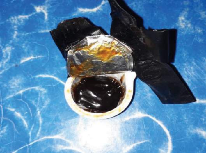
Imagen: Paquete de pasta: pasta como esta de los cadáveres de jaguar, se empaca en recipientes que luego se pueden transportar ilegalmente a China y se venden por $3,000 dólares cada una.