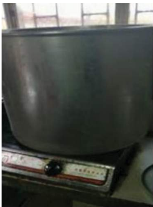
Imagen: Olla de procesamiento: a través de un proceso de ebullición y cocción, que dura hasta siete días, los cadáveres de jaguar se convierten en una pasta muy buscada para la medicina tradicional asiática.

Nicholas Bruschi, asesor de investigaciones de World Animal Protection