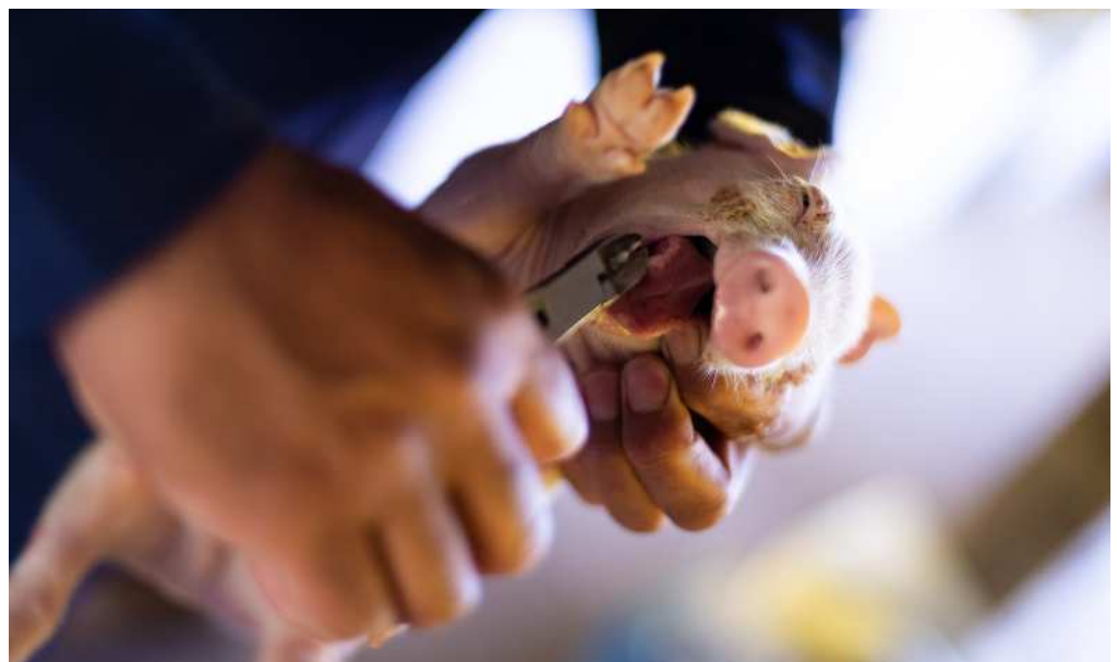
Imagen: Un productor corta los dientes de un lechón de 72 horas de nacido. Esta práctica se asocia con el uso excesivo de antibióticos y además se poder ser evitada.

Para lograrlo, hacemos un llamado a una acción concertada de los minoristas globales, el sector financiero y los sectores de producción de proteína animal, gobiernos y organizaciones intergubernamentales para que se elimine gradualmente la crianza industrial. El abandonar este sistema cruel e ineficiente, que depende del uso excesivo de antibióticos, es de vital importancia para proteger la salud de las personas, los animales y las economías de futuras pandemias.