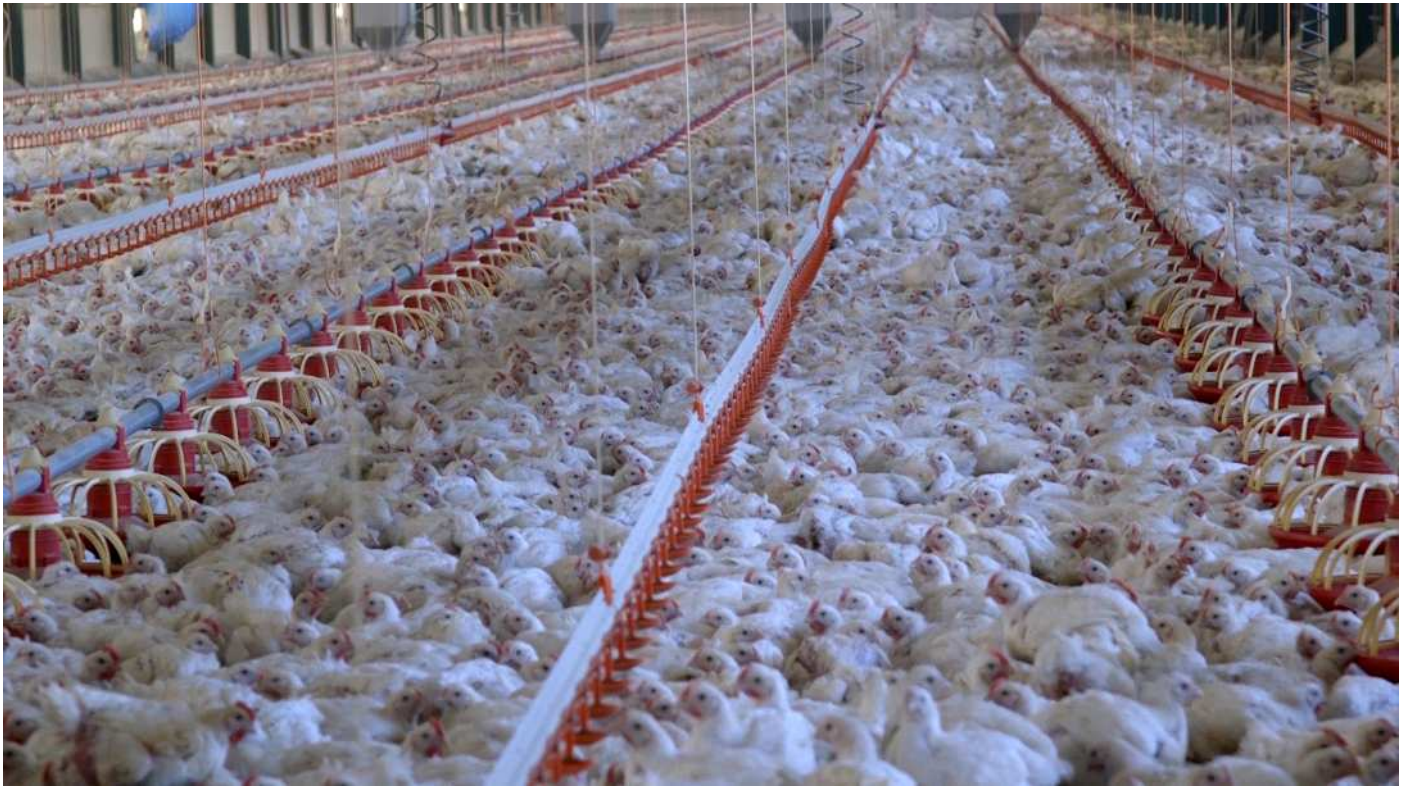
Imagen: Razas de pollo de crecimiento rápido que sufren terribles problemas de salud, entre los que están las piernas deformes y las dificultades del corazón y los pulmones. Además, los pollos son mantenidos en condiciones de hacinamiento en un área menor a la de una hoja de papel tamaño A4.