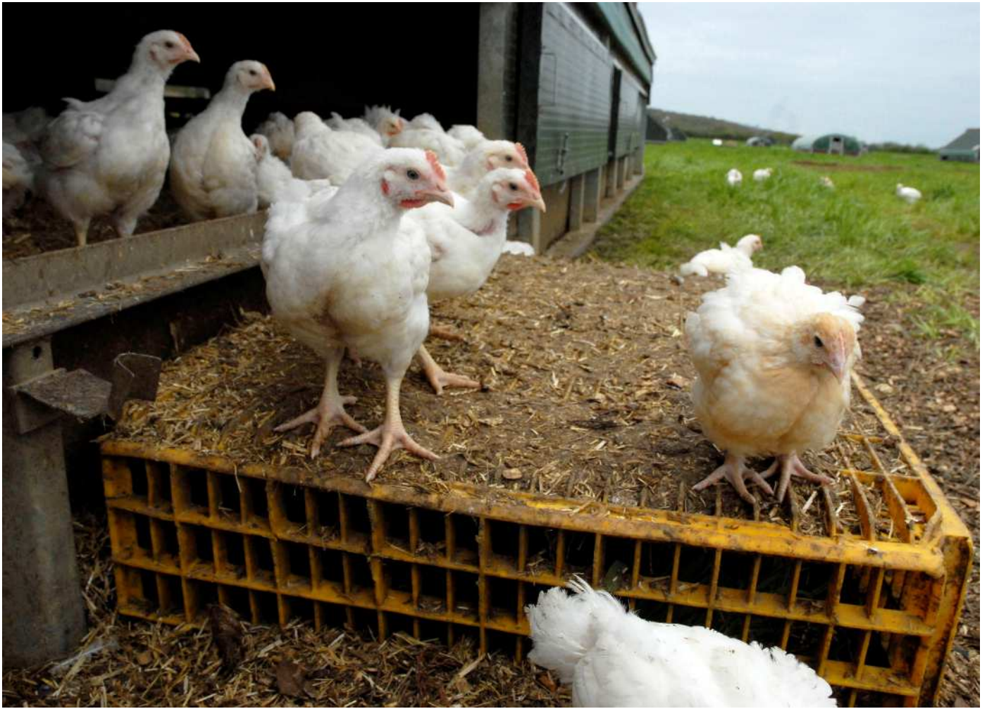
Imagen: Se ha documentado que en pollos de crecimiento más lento en sistemas con alto bienestar ha habido un uso significativamente menor de antibióticos.