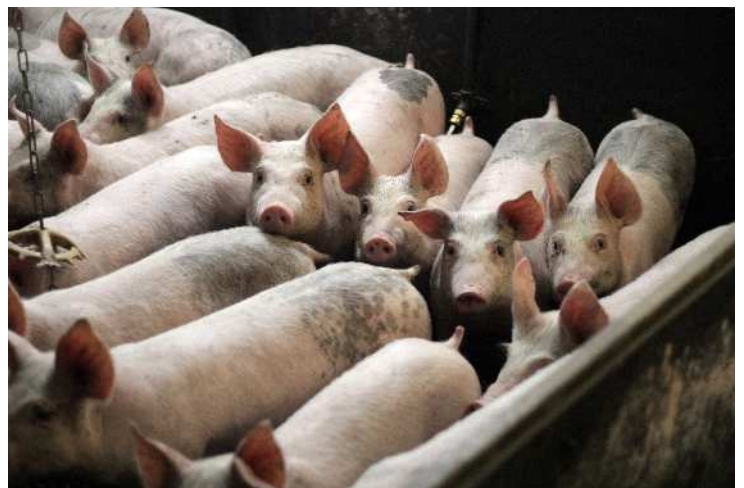
Imagen: Los cerdos criados para la producción de carne en granjas industriales se mantienen en agrestes encierros sobrepoblados. Sus colas se cortan en la primera semana de vida para tratar y prevenir la caudofagia, pero esta persiste. Los antibióticos se utilizan en el agua o en el alimento para prevenir enfermedades.

A pesar de la extensión del problema del uso excesivo de antibióticos en la crianza de animales, la industria se muestra reacia a revelar datos sobre el uso de los antibióticos. Las empresas de acuicultura de Asia son particularmente mediocres en la presentación de informes sobre el uso de antibióticos; sin embargo, existe un problema en el sector de la proteína animal xxvii .