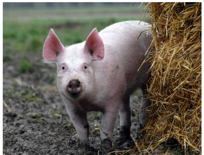
Imagen: Los sistemas orgánicos suelen incluir el acceso al exterior y se ha demostrado que reducen la resistencia a los antibióticos en comparación con los sistemas de cría industrial sin antibióticos.