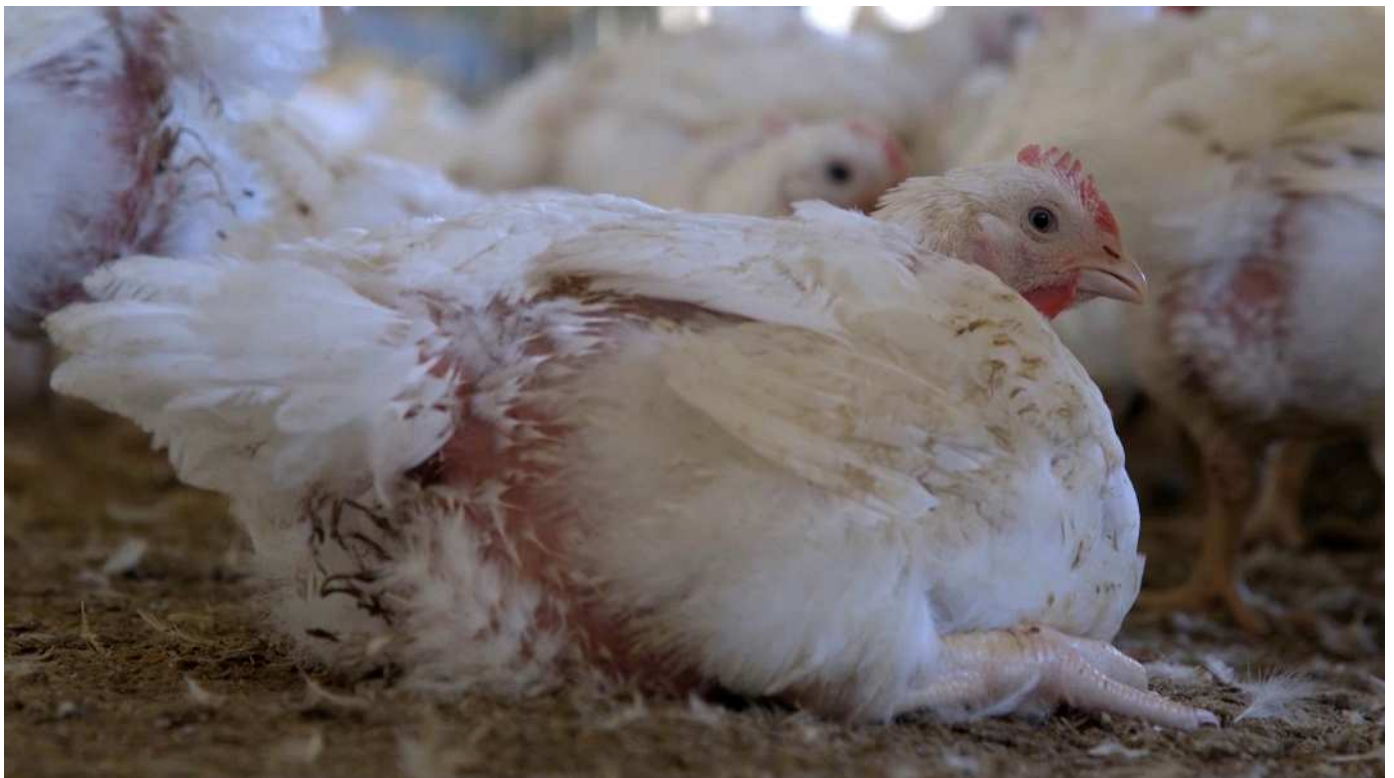
Imagen: Anualmente se producen alrededor de 60 millones de pollos de engorde. Se crían selectivamente para que crezcan a un ritmo acelerado de manera antinatural con el fin de producir carne económica entre 40 y 46 días.

"Tenemos abundante evidencia que prueba el hecho de que, cuando los animales están hacinados, viven en condiciones insalubres y se utilizan en ellos dosis bajas de antibióticos para la prevención de enfermedades, se está preparando una perfecta incubadora de mutaciones espontáneas en el ADN de la bacteria [...] Con más mutaciones espontáneas aumentan las probabilidades de que una de esas mutaciones ofrezca resistencia al antibiótico presente en el ambiente" xx .